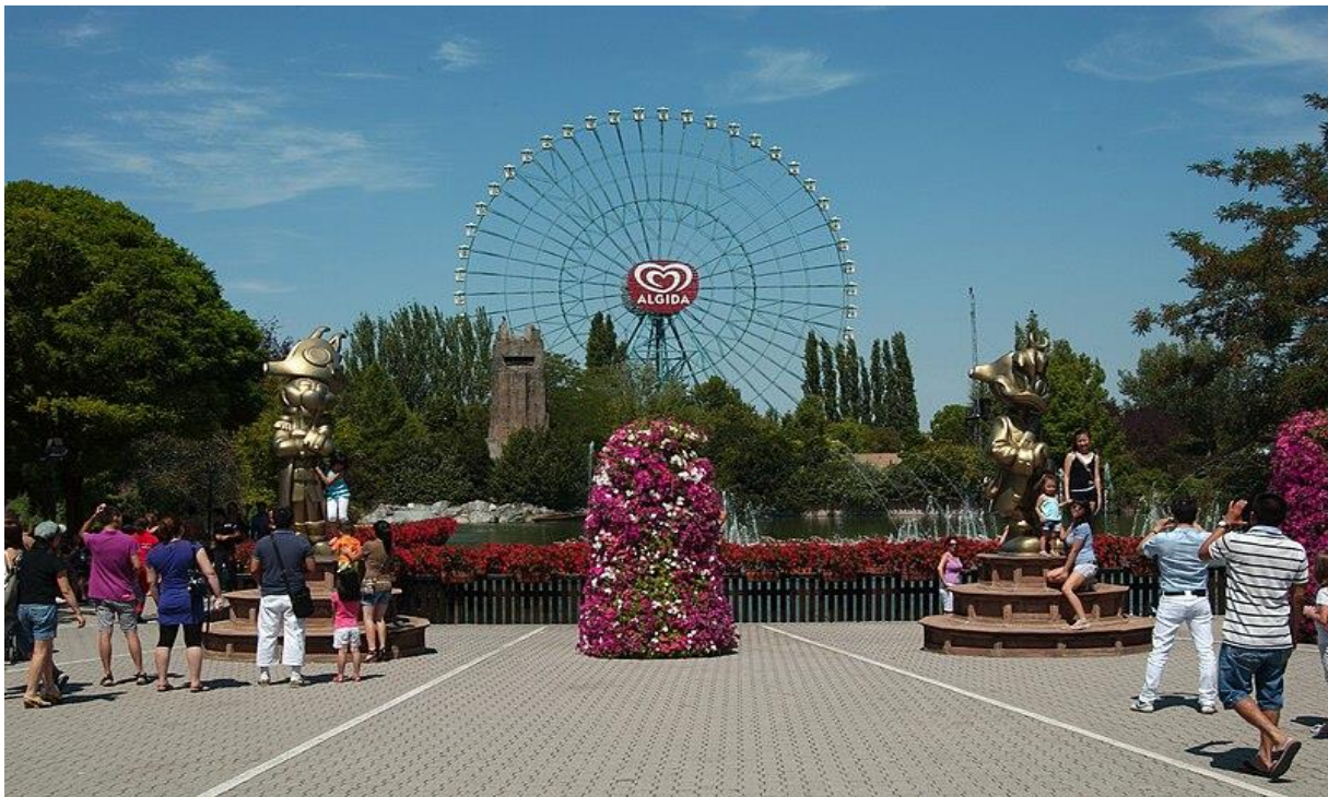
PARK ROZRYWKI MIRABILANDIA

Mirabilandia to jeden z najstarszych i największych parków rozrywki we Włoszech. To też jedna z największych atrakcji włoskiego wybrzeża w okolicach Ravenny, San Marino i Rimini. Obecnie na terenie Mirabilandii znajduje się ponad 40 atrakcji, zróżnicowanych ze względu na wiek, stopień intensywności czy tematykę. Choć odkrywanie ich na własną rękę to najlepsza zabawa, warto uzbroić się w listę kilku najstynniejszych, których absolutnie nie można pominąć. Mirabilandia jest teraz uwielbiana i odwiedzana przez miliony turystów nie tylko z Włoch, ale i z całego świata.