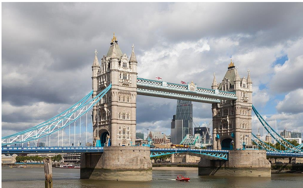
Diego Delso, CC BY-SA 4.0