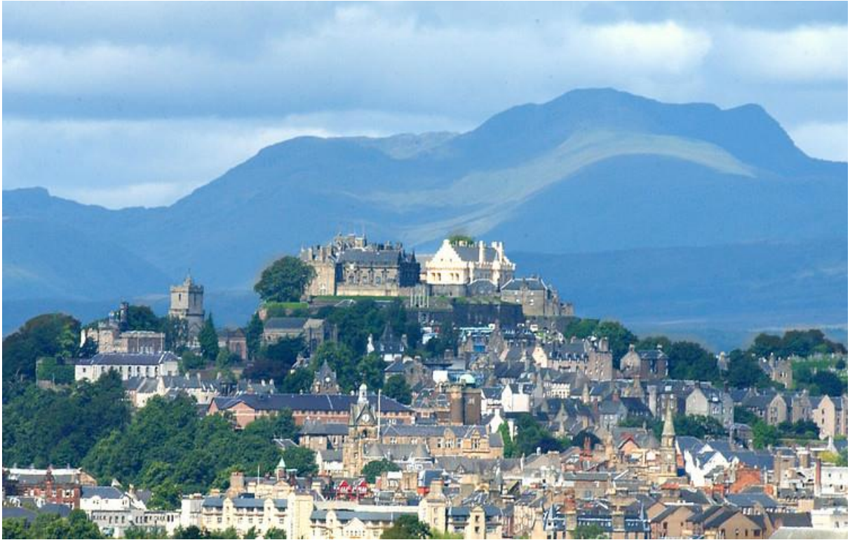
License Creative Commons John McPake