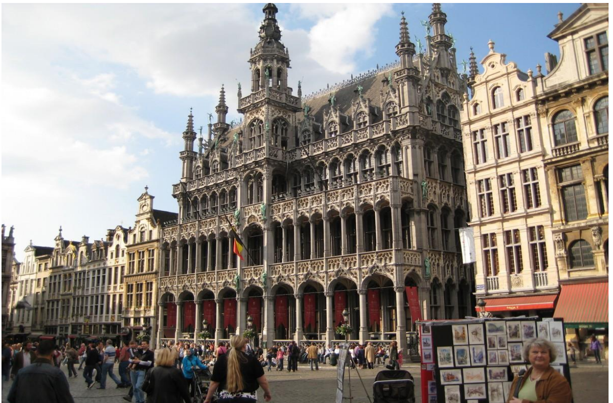
CC0 Domena publiczna