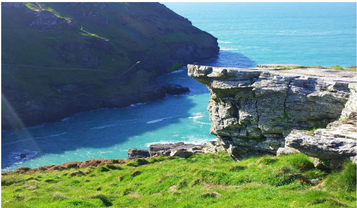
Needpix.com Colin Woodcock