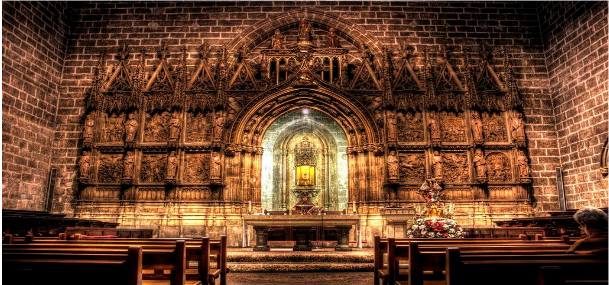
VALENCJA Św. Grall