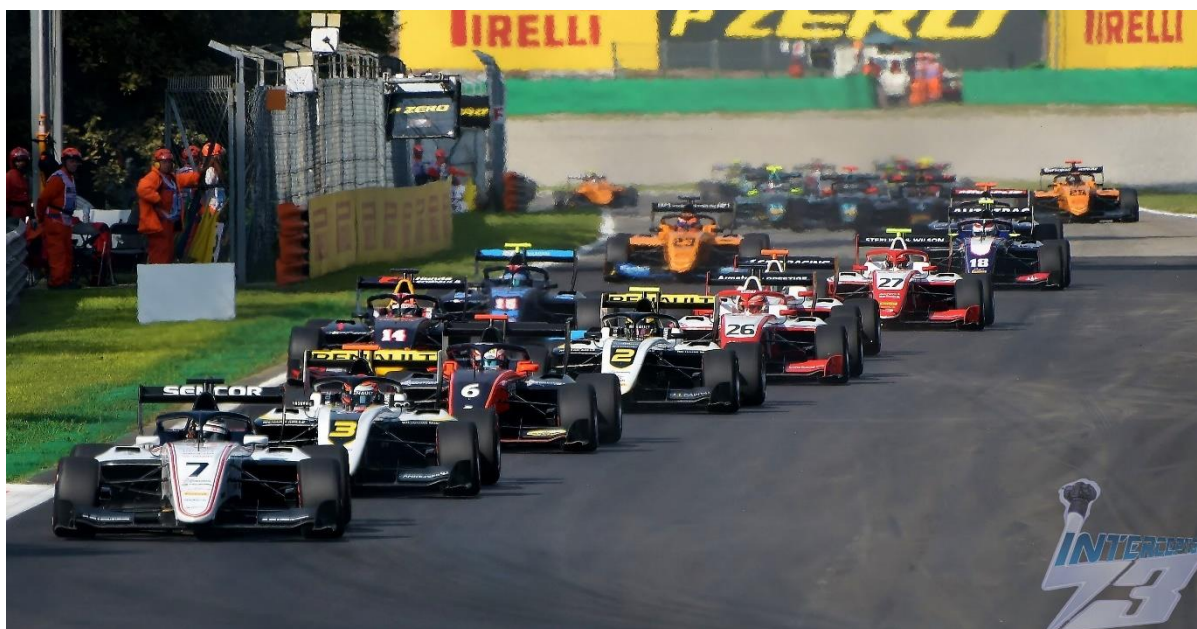
MONZA TOR FORMULE 1