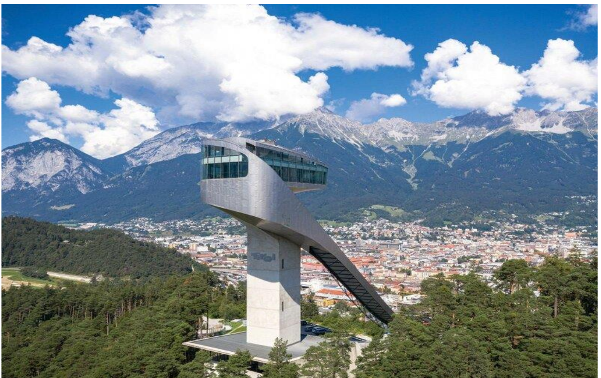
INNSBRUCK SKOCZNIA NARCIARSKA BERGISEL