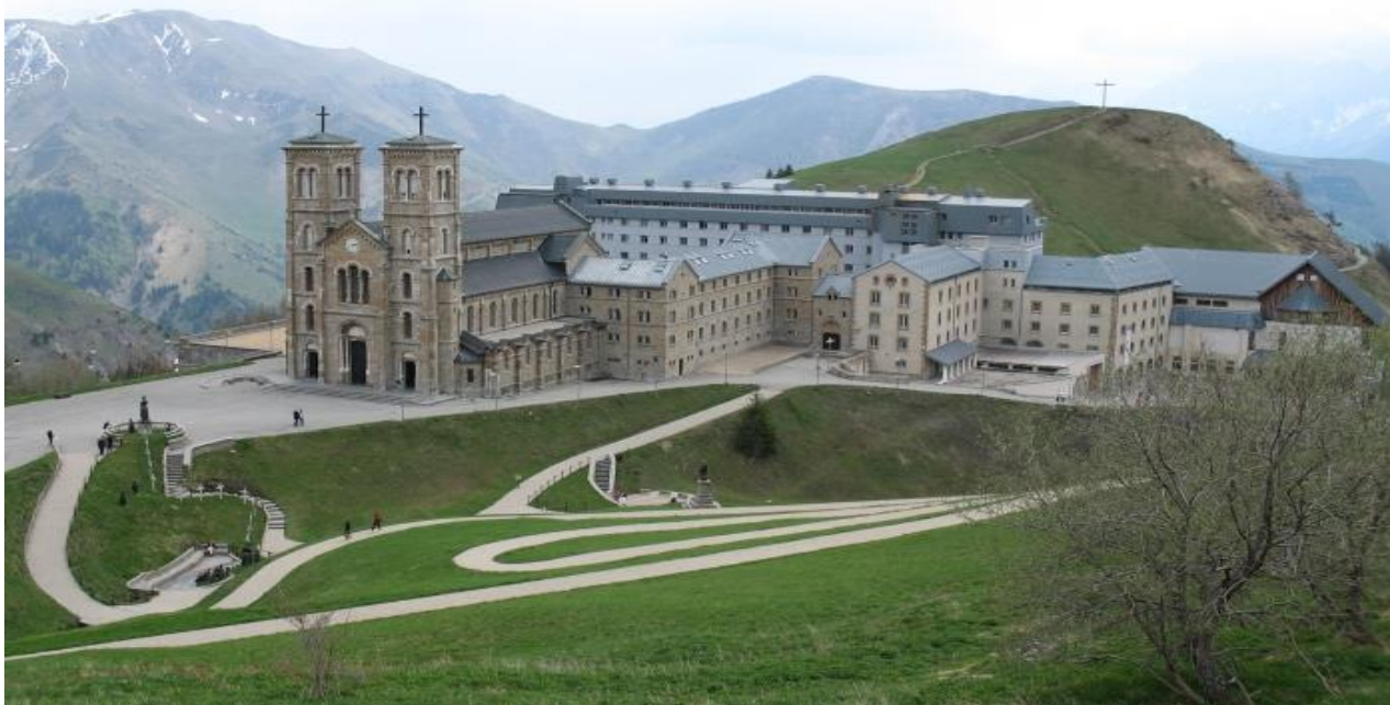
SANKTUARIUM LA SALETTE

Przejazd wspaniałą alpejską drogą widokową tzw. La Route Napoleon , którą Napoleon rozpoczął swój triumfalny pochód po powrocie z Elby. Przejazd do CORPS LA SALETTE Sanktuarium Maryjnego położonego najwyżej na świecie - na wysokości 1820 metrów n.p.m.. Widoki za oknami autokaru czy samochodu budzą zdumienie niezależnie od pory roku.