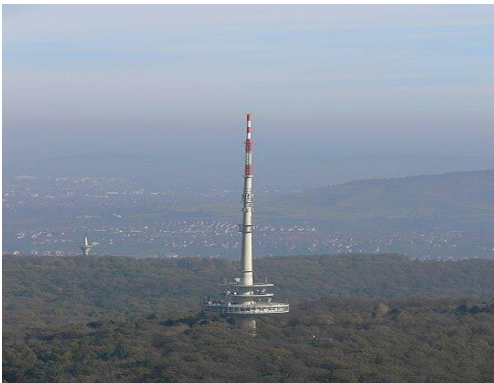
STUTTGARTER FERNSEHTURM