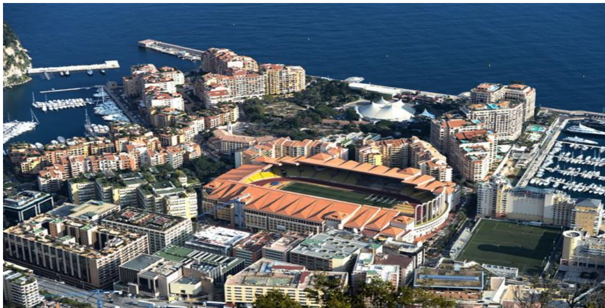
STADION AS MONACO

Kolejna gratka dla kibiców piłki nożnej to Stadion Ludwika II - siedziba klubu piłkarskiego AS MONACO. Książę Monaco w roku 1985 Rainier III osobiście dokonał otwarcia niezwyklej budowli, która po dziś dzień leży na szlaku wszystkich wycieczek po Księstwie Monako – Stade Louis II. Co ciekawe, stadion AS Monaco jako jedyny stadion na świecie może pomieścić 2/3 ludności swojego kraju.