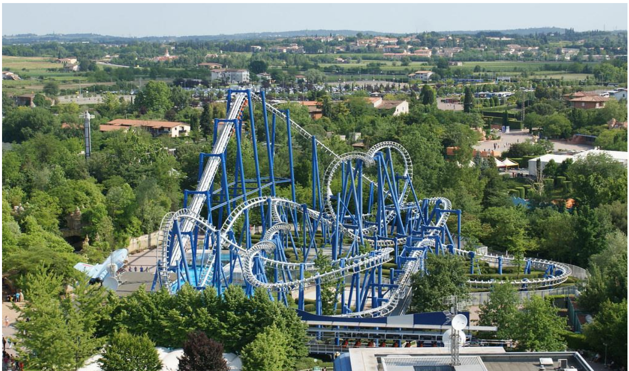
PARK ROZRYWKI GARDALAND

Gardaland to najbliższy Disneyland we Włoszech. Wewnątrz tego włoskiego parku rozrywki, znajdziesz fantastyczne rollercoastery i przejażdżki, które zapewnią rozrywkę całej rodzinie. Najchętniej odwiedzany park we Włoszech. W 2021 r. w parku pojawiła się nowa strefa: LEGOLAND® Water Park, czyli bajecznie i słonecznie kolorowe wodne miasteczko. To pierwszy taki park pod szyldem LEGO w Europie!