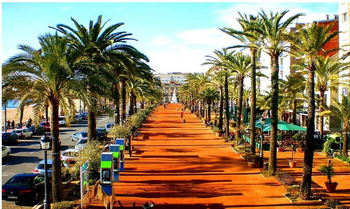
LILORET de MAR