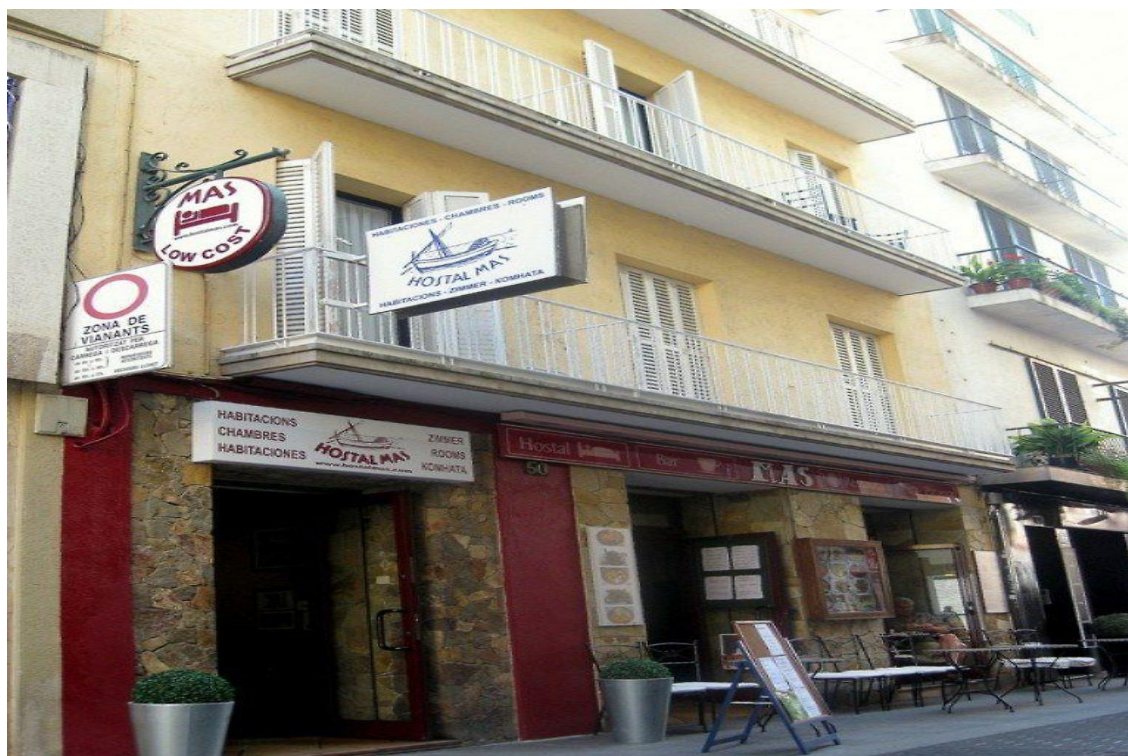
HOTEL CASA MAS